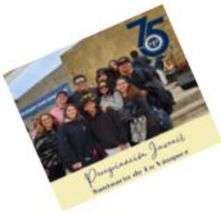
CATEQUESIS PRIMERA COMUNIÓN