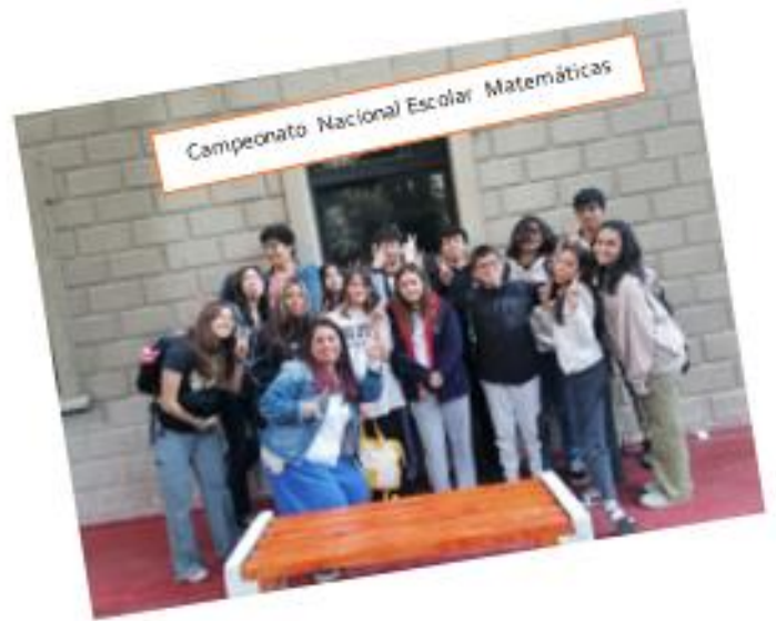
Campeonato Nacional Escolar Matemáticas