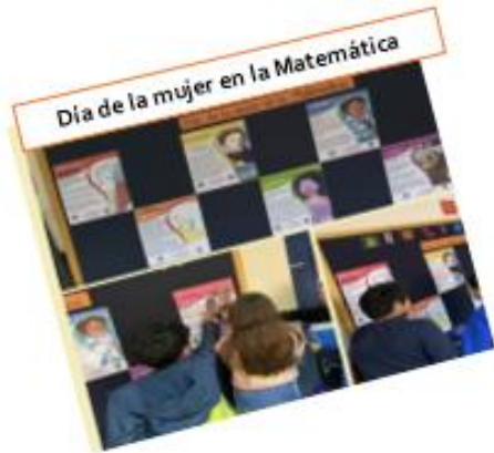
Día de la mujer en la Matemática