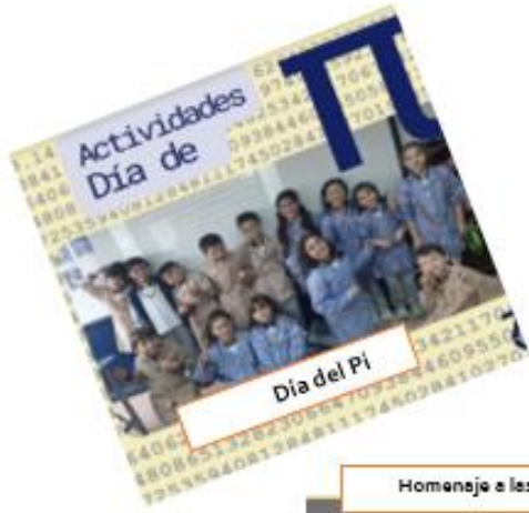
Día del Pi