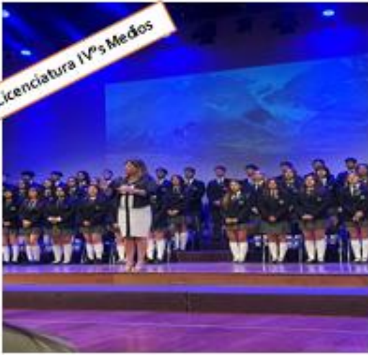
Licenciatura IV o s Medios