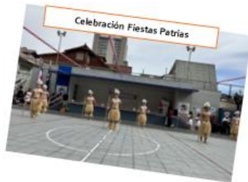
Celebración Fiestas Patrias