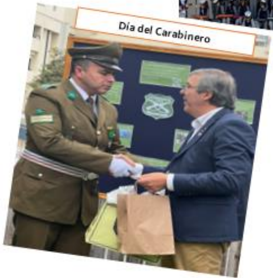
Día del Carabiniere