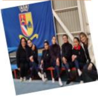
Selección Gimnasia Artística